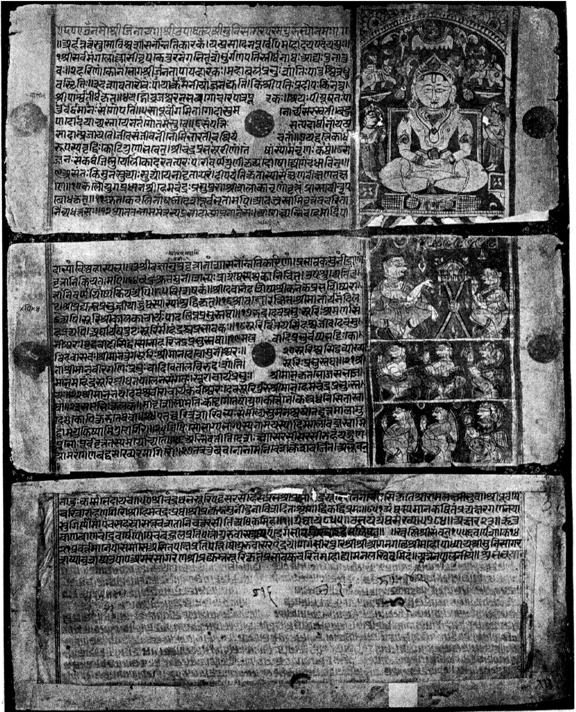
प्रभावकचरितकी B संज्ञक प्रतिके पहले, दूसरे और अन्तिम पत्रकी प्रतिकृति ।